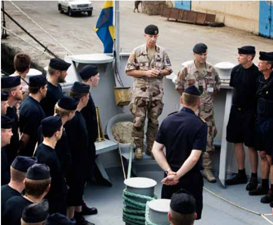
Förbandet ME 01 stod uppställda på HMS Trossö då ÖB genomförde besök.