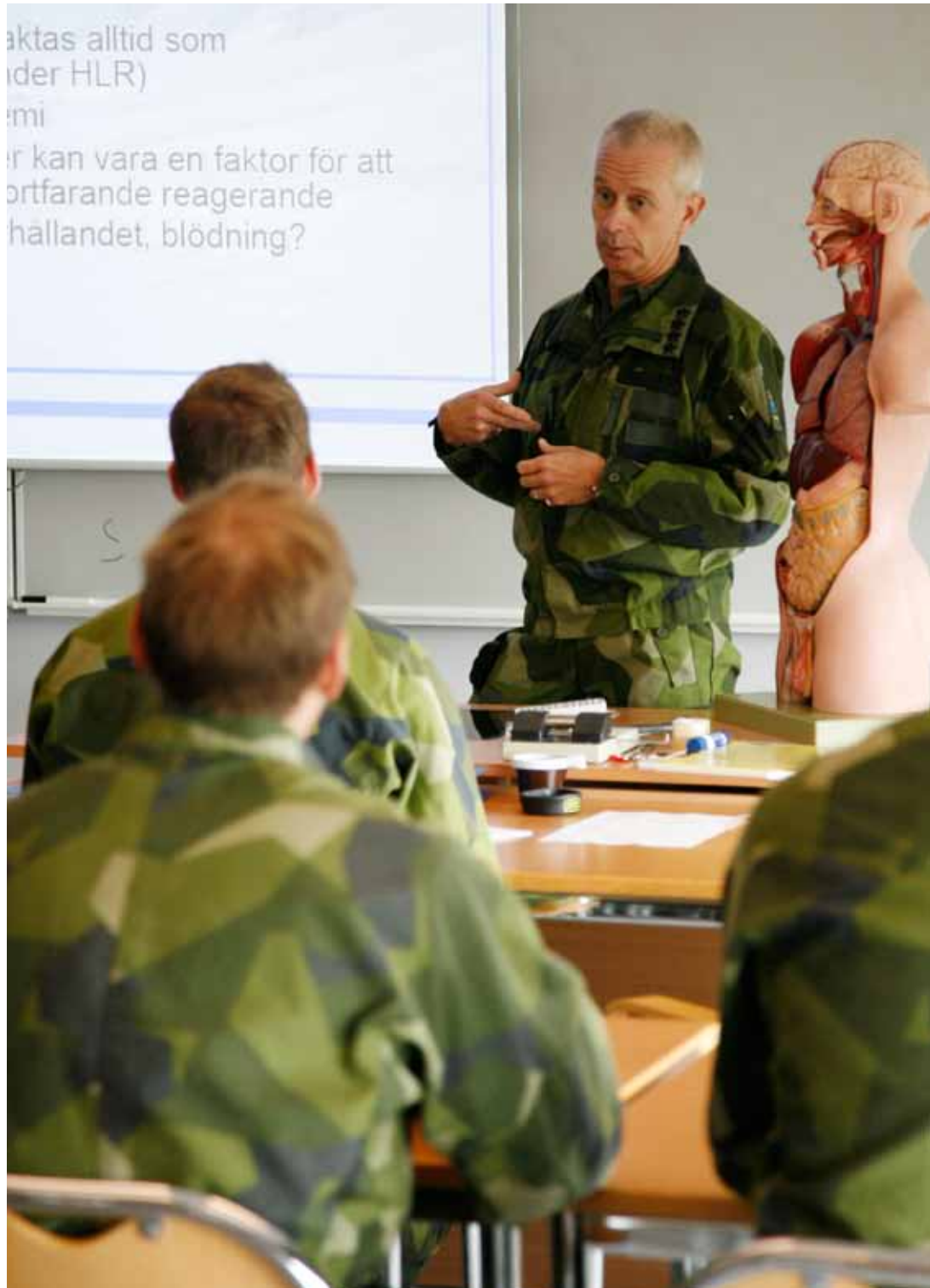
ÖB på besök vid Försvarsmedicinskt centrum i Göteborg.

Riksdag och regering fattade 2009 beslutet att införa ett insatsförsvar, baserat på frivillig rekrytering och en förändrad omvärld. Att styra Försvarsmakten i den riktningen är verkligen, för att använda en gammal klyscha, som att gira med en supertanker. När Försvarsmaktens upp-