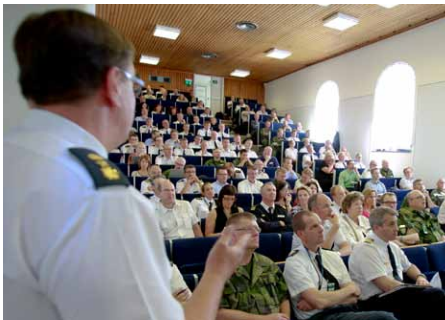
Många passade på att ställa frågor när metoden för bemanningsarbetet gick igenom.