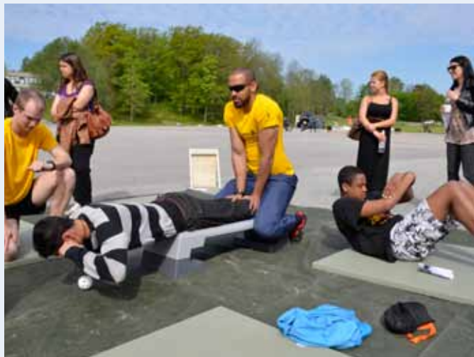
Många passade på att kolla sin fysiska status – något som är kopplat till självförtroende och som ibland upplevs som en tröskel i anställningsprocessen.