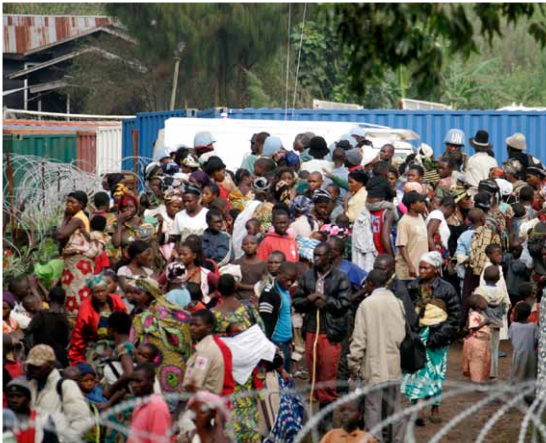
Bybor som flytt undan strider i Kitchangaområdet, Nordkivu.