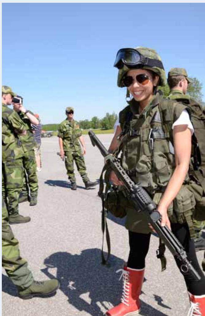
Den nya försvarsmakslooken?

Istället för att som tidigare öppna förbandet för allmänheten bjöd Livgardet i år bara in speciellt utvalda målgrupper: gymnasieskolor, politiker, tjänstemän och näringsliv från kommunen.