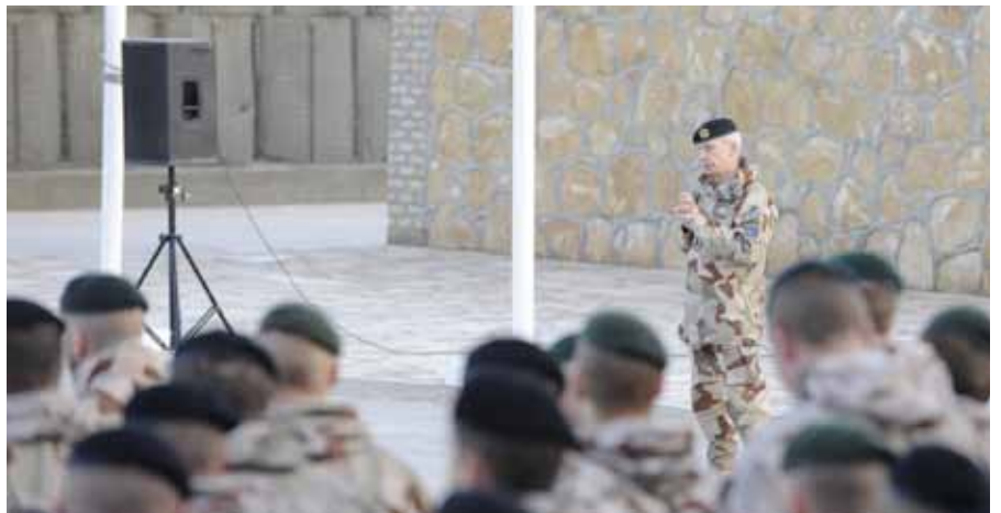
ÖB på besök hos den svensk-finska kontingenten FS 18, Afghanistan.