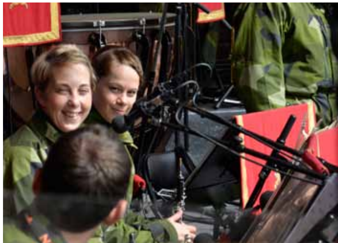
Att stimma med kollegorna är en nödvändighet för att orka fokusera när det väl gäller.