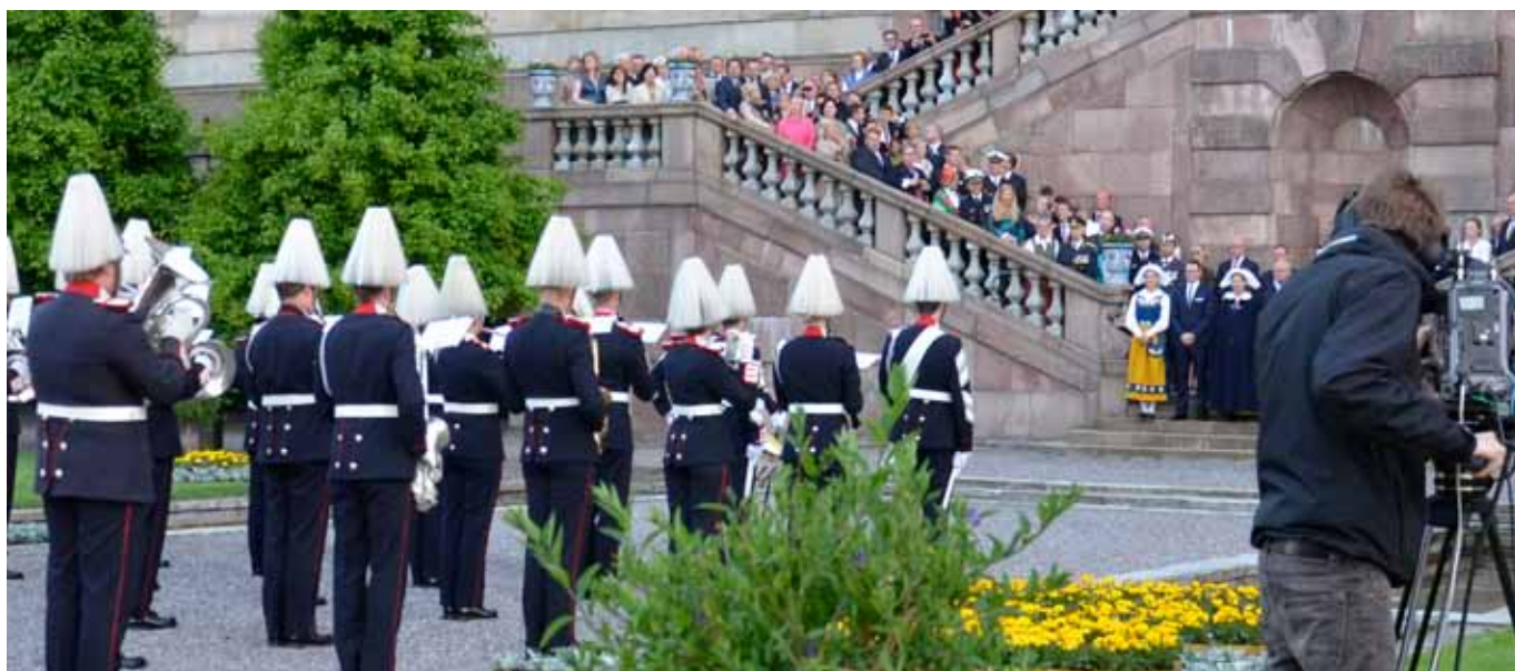
Direktsändning i SVT av Arméns tapto.