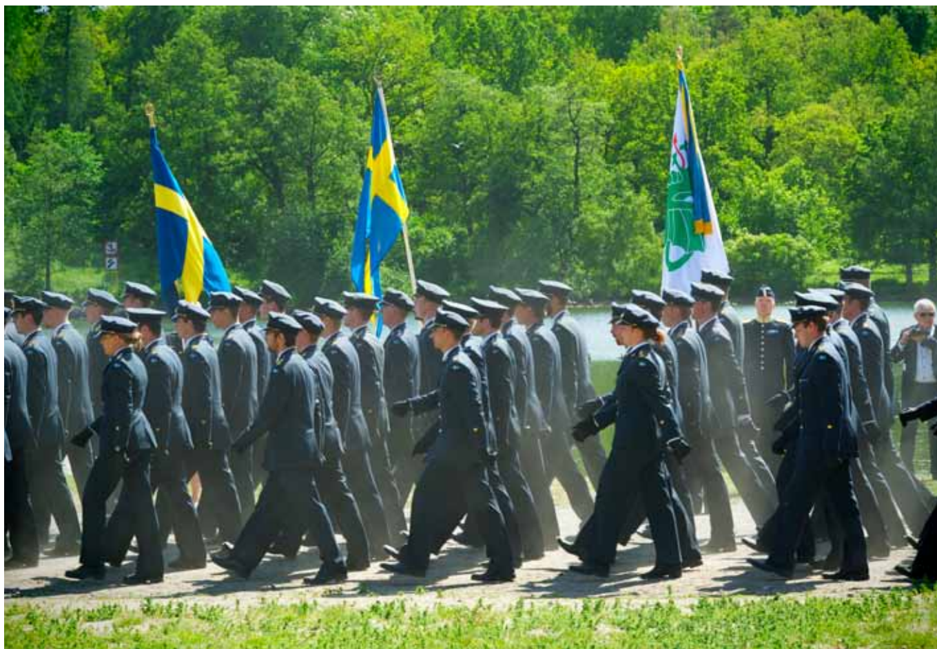
Ceremonin ramades in av arméns musikkår, kadettkompani från Militärhögskolan i Karlberg samt fanvakt och honnörsstyrkan från Livgardet.