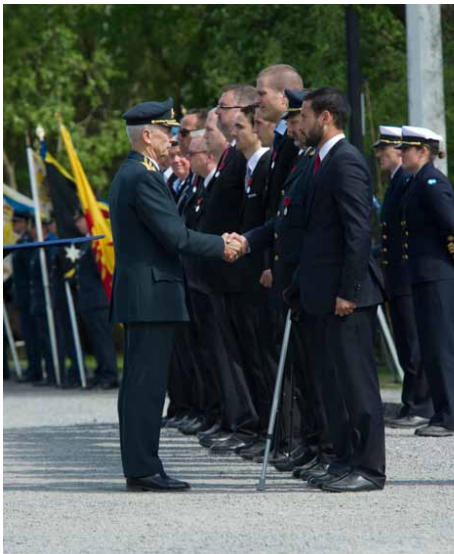
ÖB delar ut medaljerna Sårad i strid samt Försvarsmaktens förtjänstmedalj i samband med Veterandagen 2012.

– Rent militärt ser jag flera möjligheter till samarbete såväl i den nordiska kretsen som inom EU, säger Sverker Göranson.