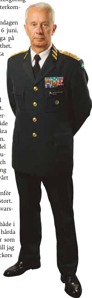
Sverker Göranson Överbefälhavare

Ni gör ett bra arbete med många viktiga resultat, både i insatserna och i förbandsproduktionen, trots den hårda arbetsbelastningen på grund av alla de förändringar som pågår samtidigt i vårt försvar. Så - med dessa ord - vill jag önska alla en trevlig sommar. Vi är väl värda några veckors ledighet för att köra med full fart igen i höst.