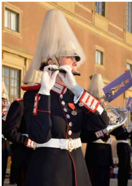
Paradmarsch på Lejonbacken.

- Precis som idrottare arbetar vi med muskler som måste tränas, det går inte att vila för länge, säger hon.