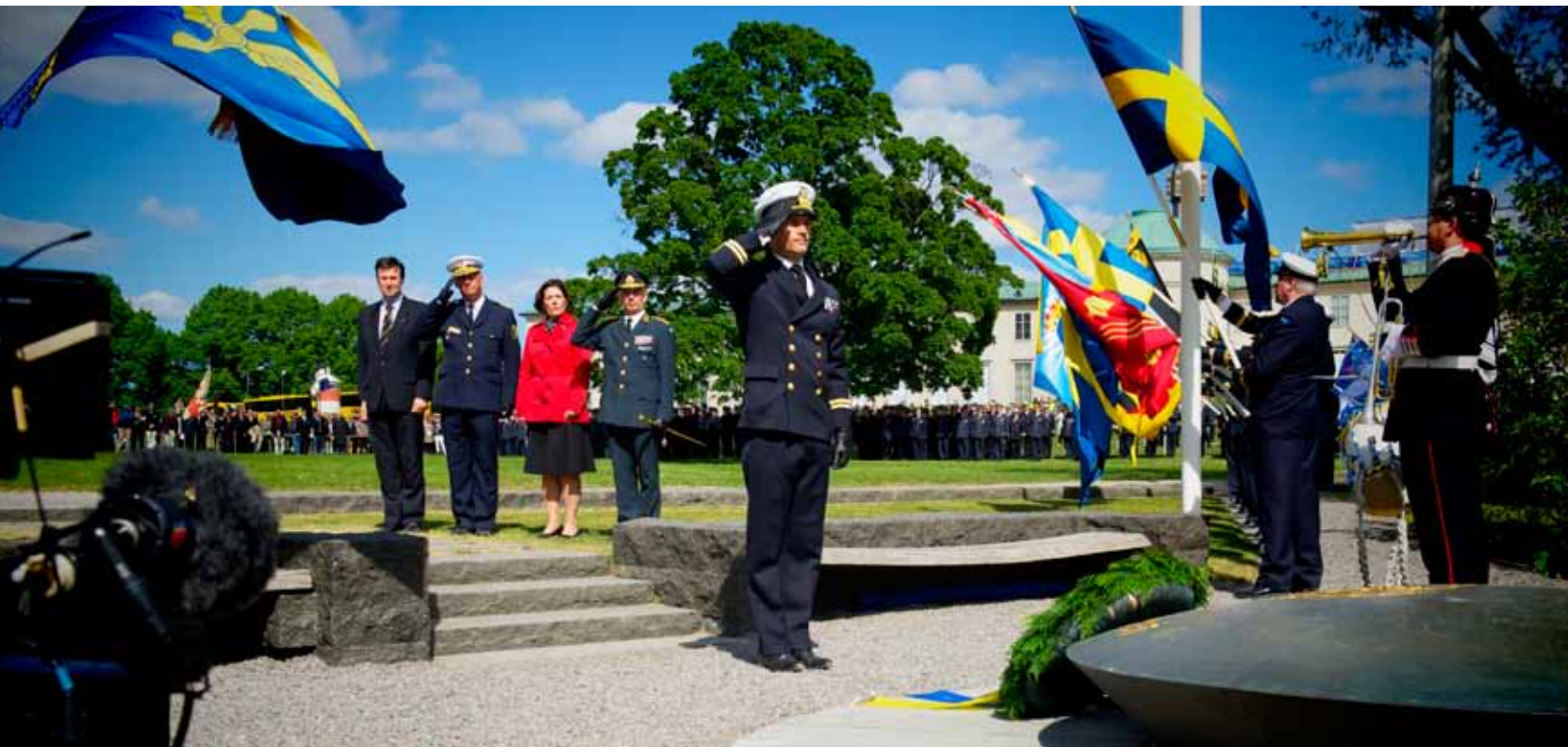
Prins Carl Philip lägger ned krans vid FN-monumentet.