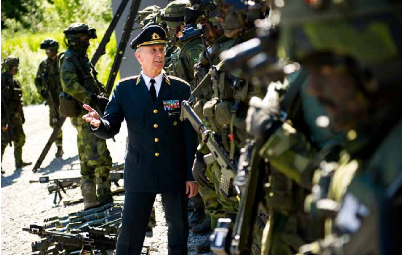
Under ett statsbesök passar ÖB på att tala med soldater på Livgardet.