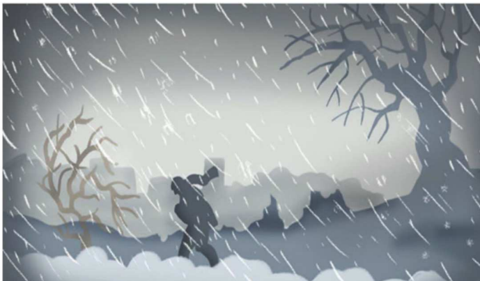
Mobilisering ska kunna genomföras under alla förhållanden. Illustration Anna-Karin Wetzig/Försvarsmakten

Om du är tvungen till ekonomiska utlägg för biljett för inställelseresan så behåll kvittot. Försvarsmakten ersätter biljettkostnaden.