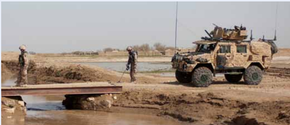
Soldater ur EOD-gruppen var dagarna efter händelsen snabbt ute i området igen och löste sin uppgift.