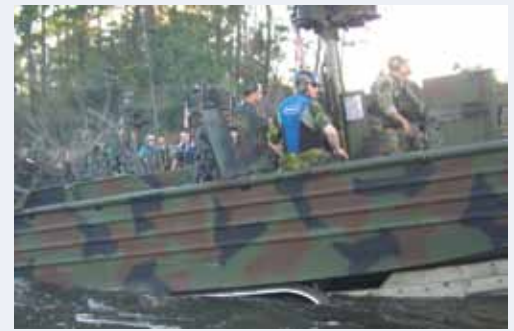
SBT-22 har egna fordon och dragkärror till båtarna. Båtarna ligger aldrig kvar i vattnet mellan olika uppgifter utan de sjösätts, löser uppgiften och tas upp. SBT-22 både eskorterar och skyddar sig själva vid de momenten.

Förbandet deltog i Irakkriget där de genomförde ett stort antal operationer längs Eufrat och Tigris. Trots flertalet stridskontakter under konflikten var det få soldater som skadades, det berodde nog både på skicklighet och i vissa fall lite tur.