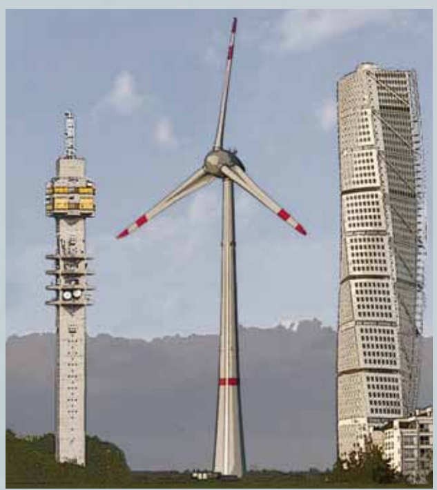
Vissa av de vindkraftverk som det söks tillstånd för är över 200 meter höga. Kakanästornet är 155 meter högt och Turning Torso i Malmö som är Sveriges högsta byggnad är 190 meter hög. Illustration: Grafisk produktion.

Det är hos kommunerna och länsstyrelsernas miljöprövningsdelegationer besluten fattas om bygglov respektive tillstånd för vindkraft ska beviljas eller inte.