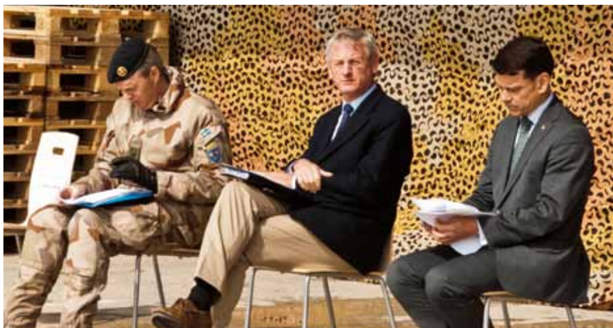
Utrikesminister Carl Bildt fanns på plats vid invigningen av TST, Transition Support Team.

Kontrasterna mellan ett Afghanistan där säkerheten har stabiliserats och fokus ska läggas på diplomatiskt stöd och biståndsinsatser, och den underliggande instabilitet som väcktes i samband med en koranbränning i USA och ledde till UNAMA-attacken är tydlig.