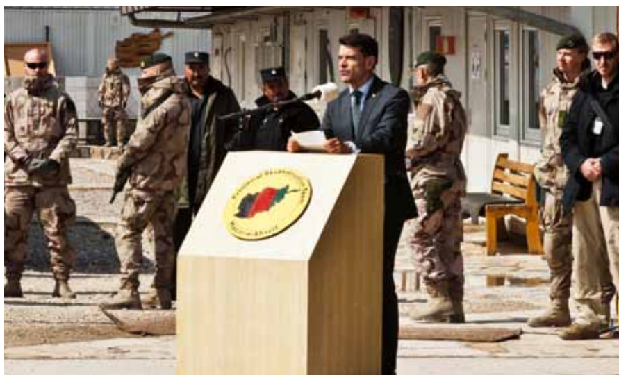
Övergången till civil ledning firades på Camp Northern Lights i mars.